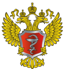
Министерство здравоохранения РФ

Уважаемые родители, здоровье каждого ребенка бесценно! Не растерявшись в экстренной ситуации и правильно оказав первую помощь, вы спасете ребенку жизнь!