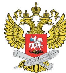
Министерство просвещения РФ